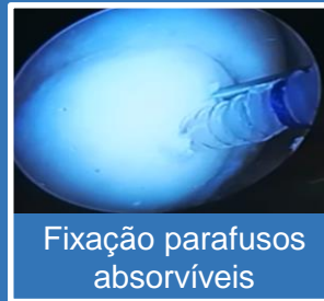
Fixação parafusos absorvíveis