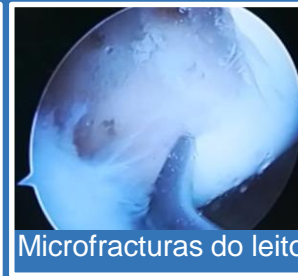
Microfracturas do leito