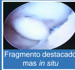
Fragmento destacado mas in situ